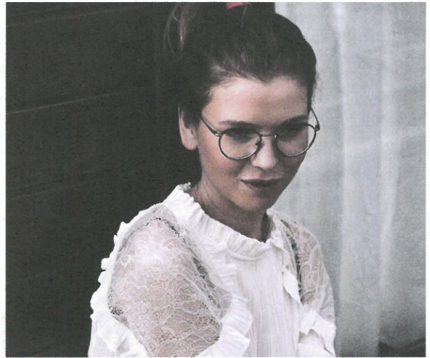
Bril: Ralph Lauren € 167