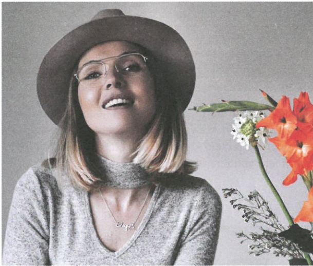
Bril: Tom Ford € 309